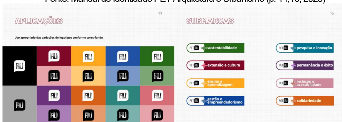
Imagem 1: Aplicações e Submarcas

O manual, portanto, não apenas organiza e normatiza a identidade visual do grupo, mas também funciona como uma ferramenta estratégica de comunicação, promovendo a visibilidade das ações do PET e reafirmando seu compromisso com a formação dos estudantes de Arquitetura e Urbanismo.