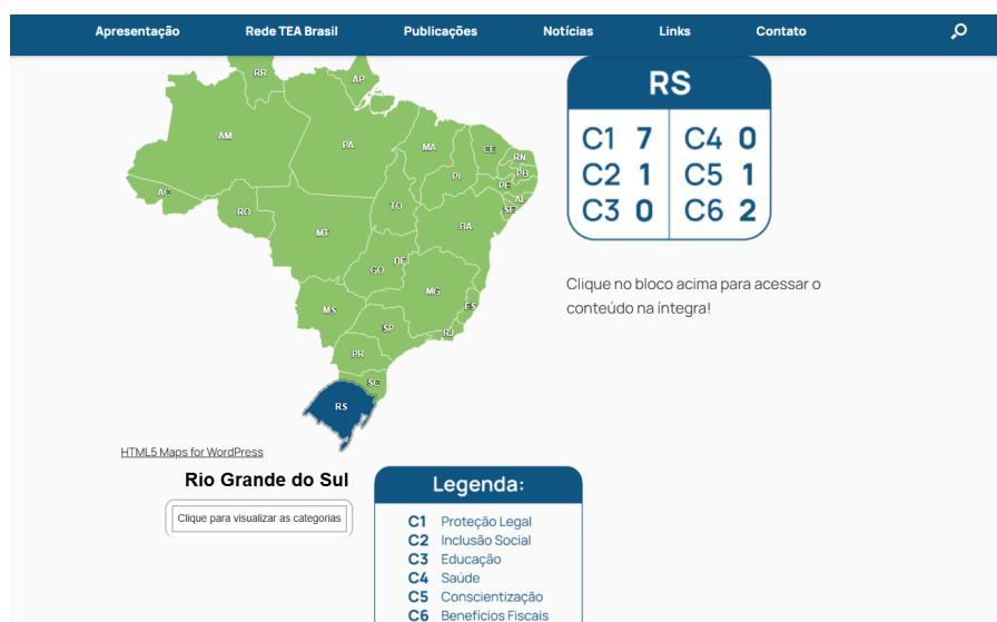
Figura 2 - Mapa interativo de leis relacionadas ao TEA no Brasil.