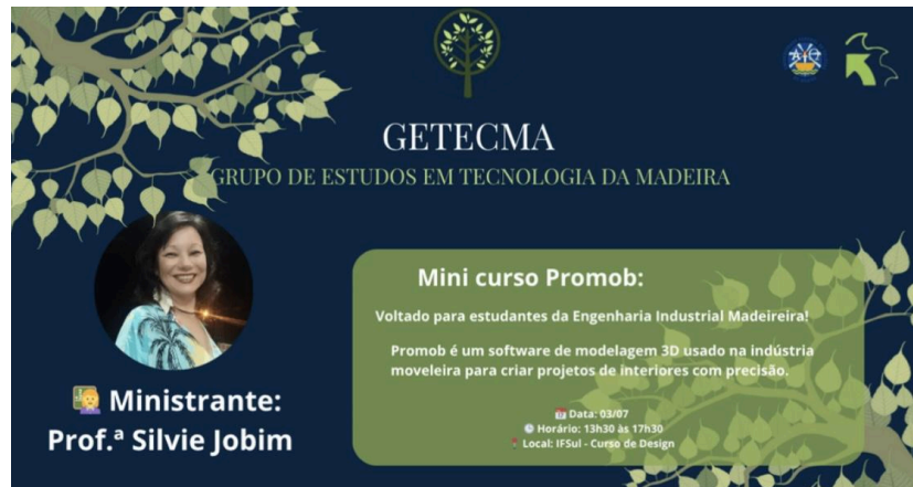
Figura 1: material divulgação minicurso PROMOB