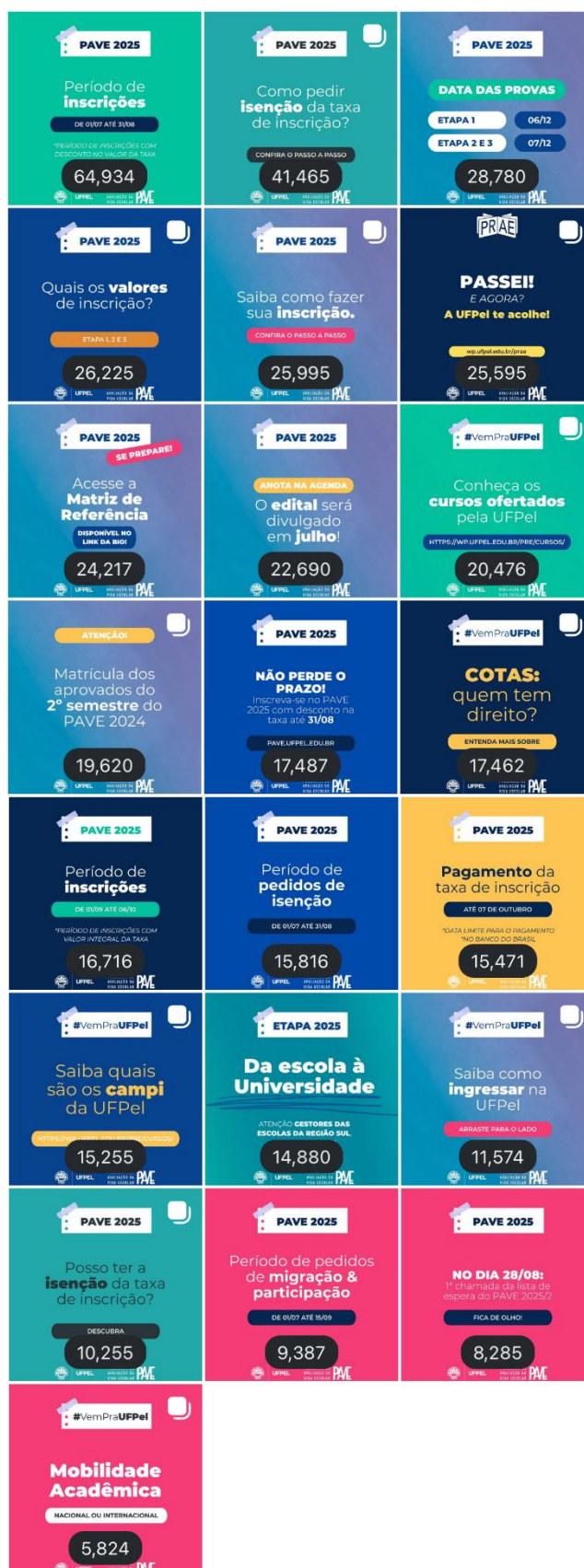
Figura 1 – Visualização geral, por ordem decrescente de Alcance das 22 postagens feitas no período de 05 de junho até 08 de agosto de 2025.

Embora a análise geral tenha considerado todas as publicações em nível de alcance total e variação de seguidores, optou-se por um recorte detalhado nos