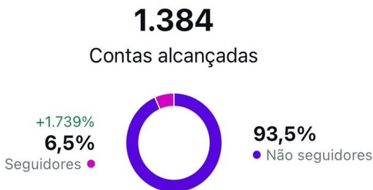
Imagem 1: Contas alcançadas no Instagram no período de 19/08/2024 até 17/09/2024.

O perfil do projeto na rede social Instagram foi criado em junho de 2023 e, até a presente data (18 de setembro de 2024), conta com um total de 104 seguidores, sendo a maioria composta por mulheres com idades entre 18 e 24 anos. O perfil possui 24 publicações, das quais 19 são postagens no formato de carrossel no feed e 4 são vídeos. Apesar de o projeto ainda se encontrar em fase inicial, já apresenta resultados significativos em termos de visualizações e alcance de contas, considerando o período em que esteve inativo. A maior parte dos seguidores reside em Pelotas/RS, sendo uma parcela significativa composta por estudantes da Universidade Federal de Pelotas (UFPEL), em especial daqueles pertencentes a cursos vinculados ao Centro de Ciências Socio-Organizacionais (CCSO).