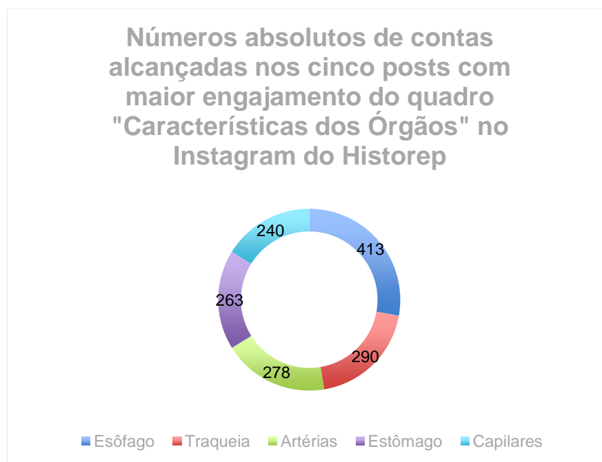
Figura 2 : Comparação dos números absolutos de contas alcançadas em publicações específicas no Instagram do Historep

Patologia Geral, em cursos como Odontologia e Medicina, dessa forma, os alunos podem recorrer a esse tipo de resumo publicados no Instagram do projeto como forma de revisão.