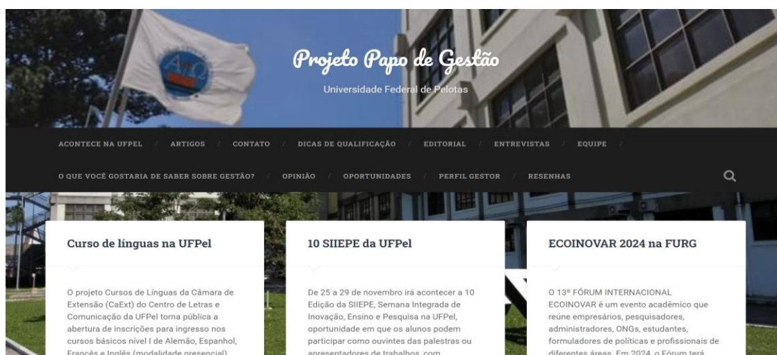
Figura 1: Print do site

O site "Projeto Papo de Gestão", que está disponível em https://wp.ufpel.edu.br/papodegestao/ , serve como uma fonte central de conteúdos atualizados que visam proporcionar à comunidade – principalmente aos trabalhadores e interessados na área de gestão – informações importantes produzidas na academia. Assim como um dos objetivos do projeto que é disponibilizar conteúdos e insights inovadores e de fácil aplicação prática, o design do site oferta a quem o acessa praticidade na busca de interesse e informações compactas, precisas e relevantes. A figura 1 a seguir apresenta a plataforma, a qual utiliza a ferramenta Wordpress :