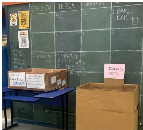
Imagem 2: Coleta de materiais recicláveis e exposição das artes produzidas sendo organizadas