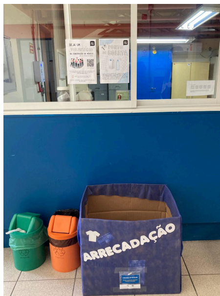
Imagem 3: Doações de materiais recicláveis para fabricação de móveis