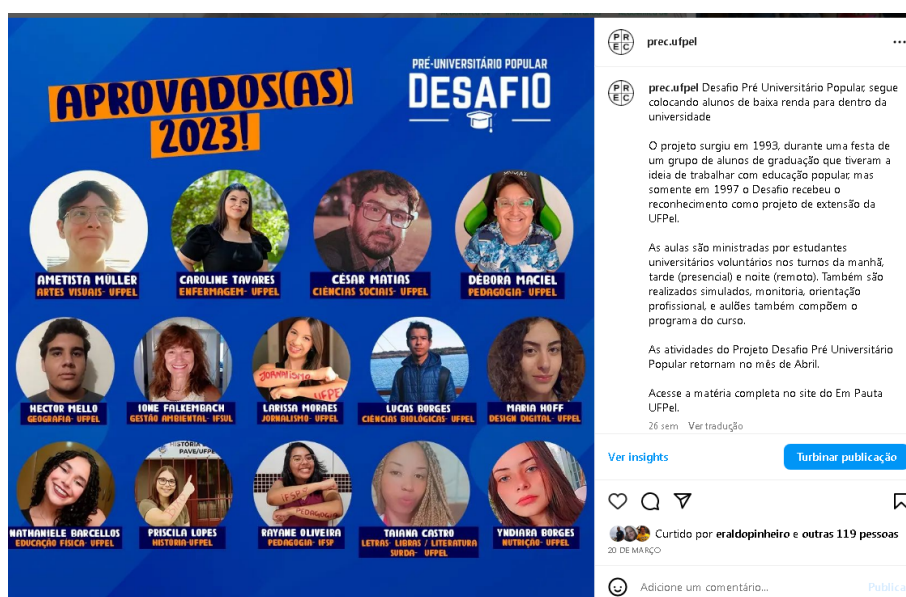
Imagem 2 - Publicação feita em 20 de março com o nome e foto dos alunos aprovados em instituições de ensino superior

A publicação em formato de reels um alcance incomum para as publicações do perfil da PREC, em média as publicações alcançaram 300 contas de alcance, porém esta conta alcançou 3847 contas e 320 contas com engajamento. A referida matéria foi destaque a nível estadual no jornal noturno da RBS TV, principal emissora de televisão do estado do Rio Grande do Sul.