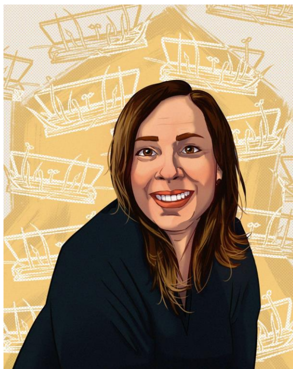
Fig 3 -Bruno da Cunha Brixner. Helene Gomes Sacco , ilustração digital, 2000 x 2500 pixels, 2023.