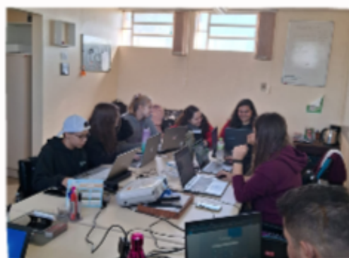
2. Oficina de Figma