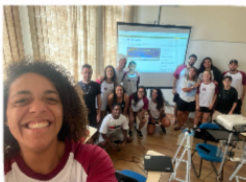
1. Oficina de currículo Lattes

Este fato acaba enriquecendo o repertório acadêmico não só dos alunos do Programa de Educação Tutorial, mas também auxiliando na construção de saberes dos discentes do campus, assim, de maneira abrangente este conteúdo acaba sendo proveitoso à comunidade, visto que a formação de excelência dos futuros docentes acarretará em um trabalho melhor executado futuramente.