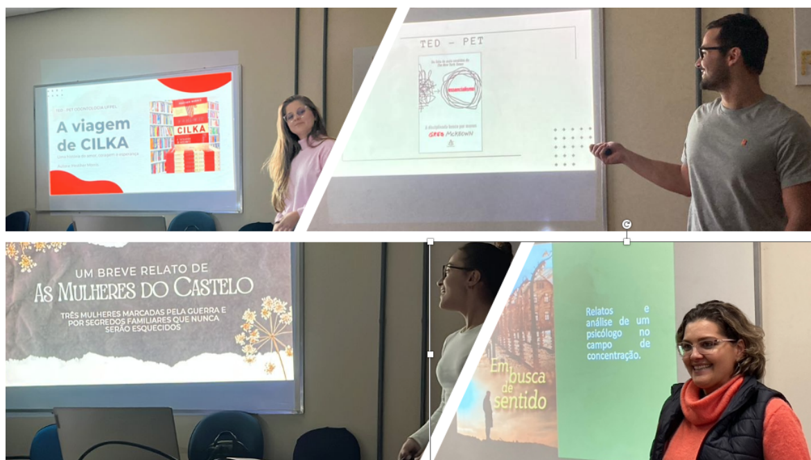
Figura 2: Ilustração de algumas apresentações do TED realizado de forma presencial.