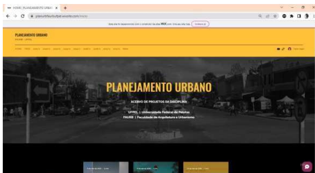
FIGURA 2: ABA DO SEMESTRE DE 2021/1