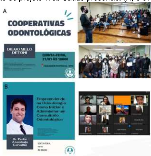
Figura 1. Evento do projeto Web Saúde presencial (A) e evento remoto (B).

A atuação presencial e remota do projeto consiste em palestras com profissionais, ciclos de debates e grupos de estudos, que ocorrem com periodicidade quin-