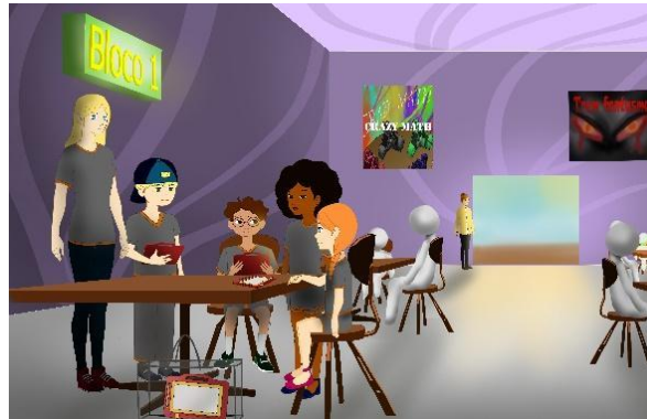
Figura 1: Saguão do parque.

Na Figura 1 temos o grupo de crianças, junto com a professora, sentados no saguão. Este espaço aparece em cada bloco do parque, sendo um espaço para resolver alguns problemas matemáticos.