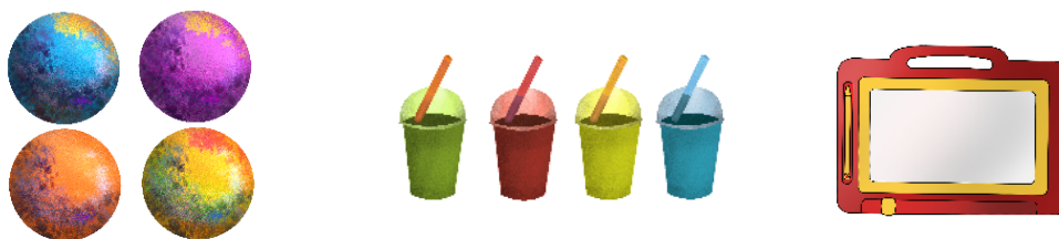
Figura 4: Brindes e painel.

Além disso, foram feitos os brindes da barraca de lembranças e o painel mágico que as crianças usam pra resolver os problemas, os quais são apresentados na Figura 4.