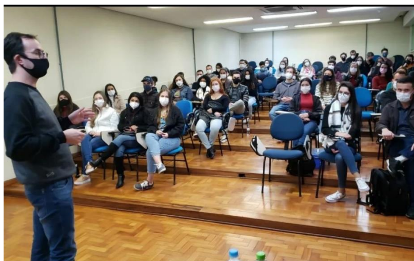
Figura 2. Palestra aberta ao publico sobre cooperativas odontológicas.

As estratégias para elaboração de materias educativos pela LAIES sempre são discutidos em reunião a ser realizada na semana seguinte ao evento, aula ou palestra. A partir dessa conjuntura, os membros são divididos em pequenos grupos, sendo, a cada momento, um grupo responsável pelo desenvolvimento do material. Dessa forma, são redigidos resumos para circular entre os componentes da liga, e servem como base para organizar “posts” a serem publicados no instagram da LAIES.