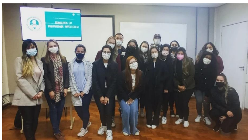
Figura 3. Aula reservada aos membros da LAIES.

Até o momento, os eventos, aulas e palestras da liga, quando realizados de forma presencial, ocorrem na Faculdade de Odontologia da UFPEL, na sala 602 ou no auditório do Programa de Pós Graduação em Odontologia. Os dias reservados para os encontros são as segundas e quintas-feiras, às 18h, sempre prezando por respeitar os dias e o horário estabelecido.