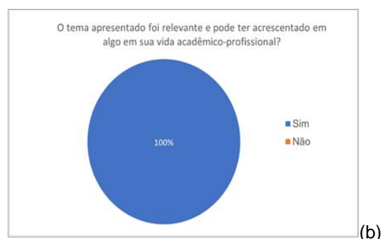
Figura 1b: O tema apresentado foi relevante e pode ter acrescentado em algo em sua vida acadêmico-profissional?

O minicurso intitulado “Currículo Lattes: da elaboração ao preenchimento”, foi realizado no dia 28 de setembro de 2021, também via plataforma online. O minicurso obteve 41 (quarenta e uma) inscrições, entretanto, a partir do formulário de satisfação foram contabilizados somente 13 (treze) respostas.