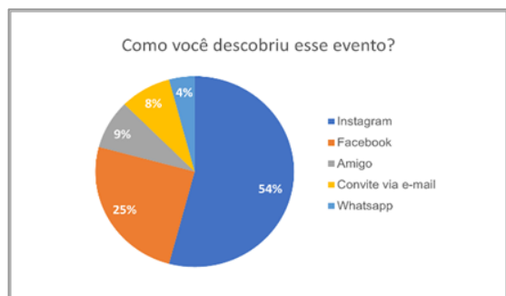
Figura 3a: Como você descobriu esse evento?

Já para a pergunta “O tema apresentado foi relevante e por ter acrescentado em algo em sua vida acadêmico-profissional?”, 100% dos entrevistados afirmaram a relevância do tema para sua vida acadêmico-profissional, da mesma forma que nos demais cursos, Figura 3b.