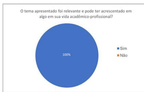
Figura 2b: O tema apresentado foi relevante e pode ter acrescentado em algo em sua vida acadêmico-profissional?

O minicurso intitulado: “Introdução às normas de escrita da UFPel utilizando a ferramenta Word”, ministrado no dia 24 de maio de 2022, via plataforma online, mostrou que 54 alunos realizaram a inscrição, entretanto, a partir do formulário de satisfação foram contabilizados apenas 24 participantes.