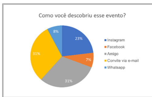
Figura 2a: Como você descobriu esse evento?

Observa-se na Figura 2b, que a resposta referente a pergunta “O tema apresentado foi relevante e pode ter acrescentado em algo em sua vida acadêmico-profissional?”, assim como o minicurso já citado anteriormente, também apresentou 100% na resposta, mostrando novamente a importância dos minicursos para a formação acadêmica-profissional.