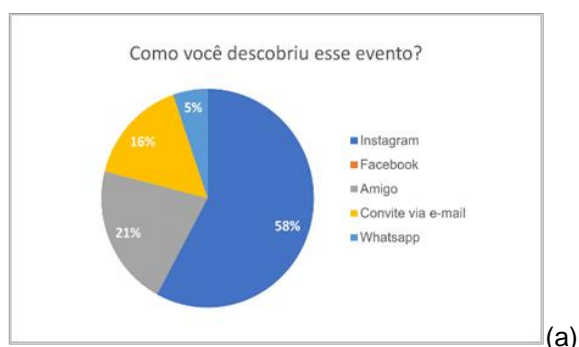
Figura 1a: Como você descobriu esse evento?

A Figura 1a, aborda a questão: “Como você descobriu esse evento?”, onde observa-se que 58% das respostas foram através da plataforma do Instagram, 21% descobriram através de um amigo, 16% por meio de um convite via e-mail e 5% através do aplicativo WhatsApp. Esse resultado demonstra que a página do grupo NEEP no Instagram possui uma ampla divulgação. Já a Figura 1b, apresenta a questão: “O tema apresentado foi relevante e por ter acrescentado em algo em sua vida acadêmico-profissional?”, sendo relevante para todos os participantes, atingindo 100% das respostas, demonstrando a importância do assunto abordado no minicurso.