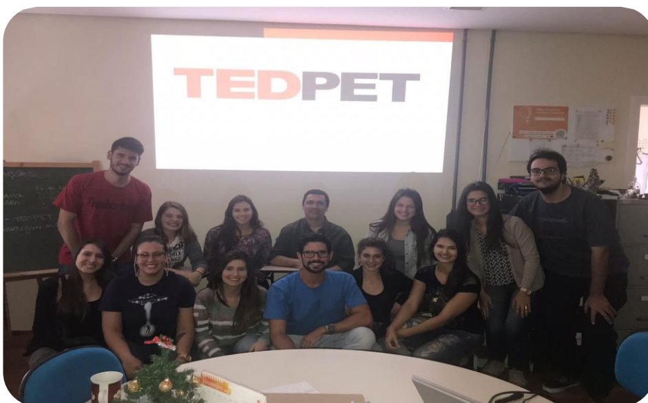
Figura 1: Fotografia do grupo PET Odontologia organizando o cronograma de apresentações.

A ordem das apresentações é definida no início do ano, por sorteio (Figura 1). Cada integrante do grupo PET estuda um assunto de seu interesse ou de interesse para o grupo e apresenta em aproximadamente 20 a 30 minutos, explicando o mais claro possível para que seus ouvintes compreendam sua idéia. No fim de cada apresentação há um debate sobre o tema apresentado, além da avaliação do grupo sobre pontos importantes e sugestões a serem narradas ao apresentador.