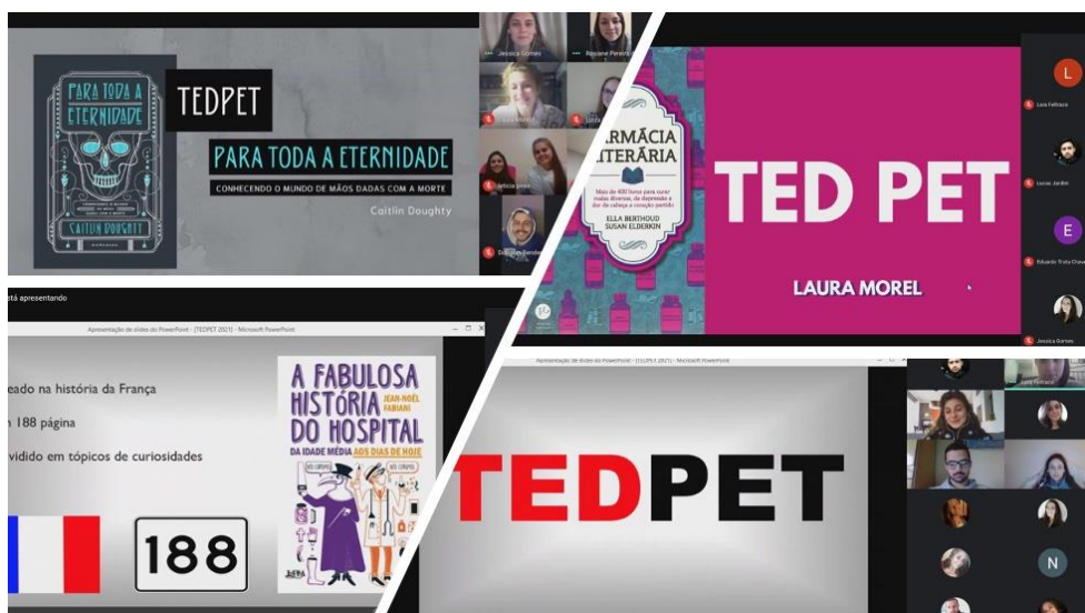
Figura 2: Ilustração de algumas apresentações TED realizado de forma remota no período de ensino remoto.