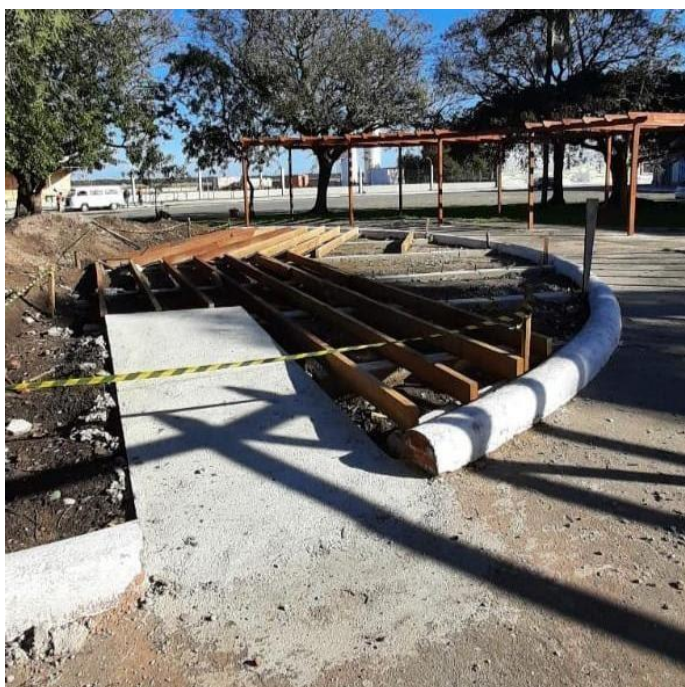
Figura 3 - Rampa de acessibilidade instalada