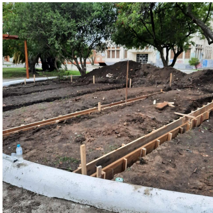
Figura 2 - Terreno regularizado/nivelado e fôrmas instaladas