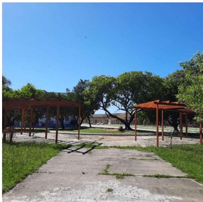
Figura 1 - Pergolados instalados