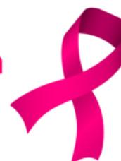
Figura 1. Imagem com os contatos do programa destinado à saúde da mulher.

Cada publicação da campanha do Outubro Rosa 2020 do Historep foi elaborada contendo em média 9 imagens (Figura 2).