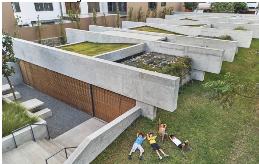
Figura 3: Plaza Cultural Norte