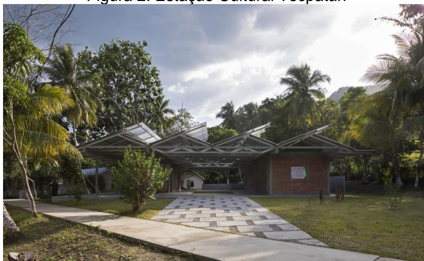
Figura 2: Estação Cultural Tecpatán