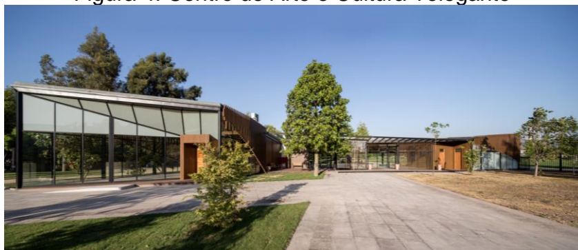
Figura 4: Centro de Arte e Cultura Telegante