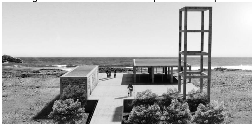
Figura 1: Centro Cultural Cobquecura - Campo Baeza