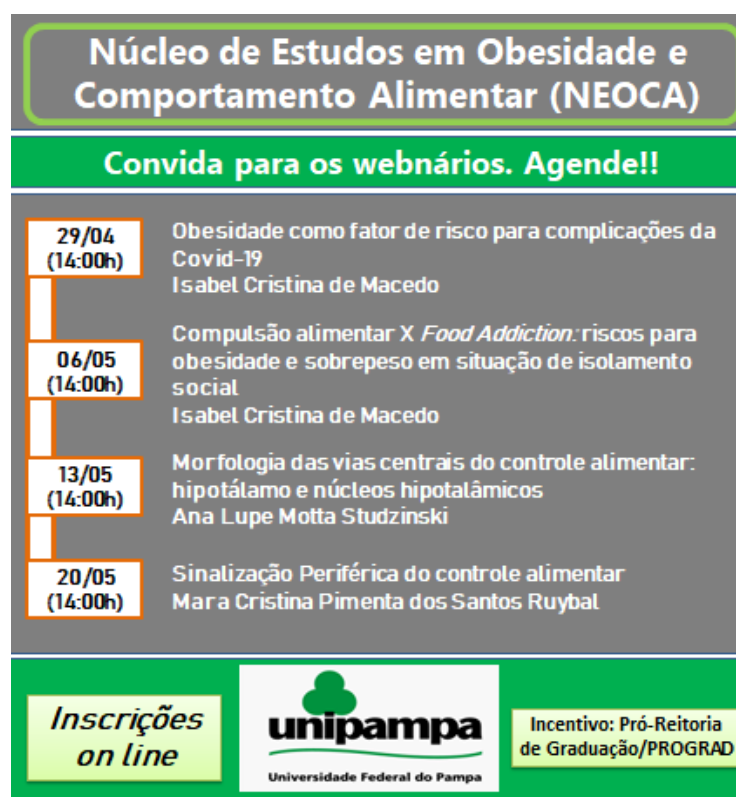
Figura 1. Folder digital para a divulgação dos Webnários do Projeto de Ensino Núcleo de Estudos em Obesidade e Comportamento Alimentar (NEOCA).

Os webnários introdutórios do NEOCA foram incentivados pela Pró-reitoria de Graduação da Unipampa, visando oferecer atividades de ensino aos acadêmicos durante o período de distanciamento social em função da pandemia. Dessa forma, os docentes se reuniram para elaborar uma série de 04 webnários que se constituíram na atividade inicial do núcleo de estudos (Figura 1).