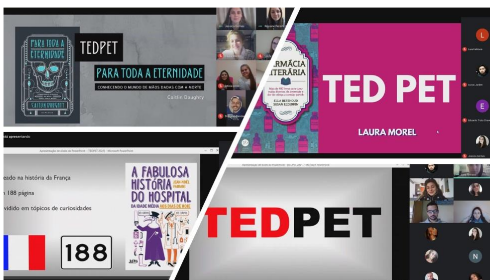
Figura 2: Ilustração de algumas apresentações TED PET realizado de forma remota no período de quarentena.

Apresentadores acadêmicos do TED são muitas vezes escolhidos como destaque em Congressos e Jornadas porque acabam exercitando a erudição de forma robusta e constante, sendo reconhecidos em suas áreas, segundo SUGIMOTO (2013). Isso significa que ao utilizarem métodos de apresentação TED, evoluem significativamente seu processo de comunicação, desenvolvem sua capacidade oratória e a dinâmica de suas apresentações (GALLO, 2014; ANDERSON, 2016)..