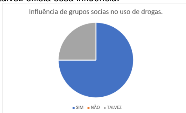
Figura 1. Gráfico sobre percepção da influência de grupos sociais no uso de drogas.

Nossos resultados estão baseados nas respostas que 12 participantes deram através do questionário aplicado ao final da sessão. O filme retrata a presença de amigas e a relação delas com as drogas, de acordo com isso a Fig. 1 demonstra as respostas fornecidas pelos inscritos, onde é possível observar que 75% dos participantes têm certeza que os grupos sociais influenciam ao uso de drogas e 25% pensam que talvez exista essa influência.