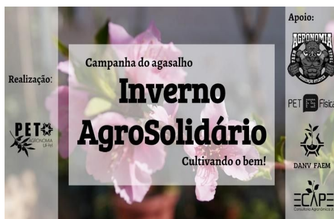
Figura 2 - Divulgação da campanha do agasalho.