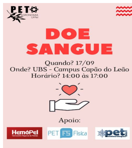
Figura 4 – Divulgação doação de sangue.