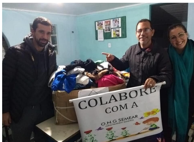
Figura 3 - Doação dos agasalhos para ONG semear.

Nos dias vinte e sete, vinte e oito e vinte e nove de agosto foi realizado pelo grupo o evento “atualizações de grandes culturas em terras baixas: soja e arroz” onde conseguiu-se arrecadar cerca de cento e vinte quilogramas de alimentos que foram destinados para a ONG sopão de rua. Os itens sugeridos foram: arroz, massa, açúcar e feijão, mas foi doado também farinha e leite.