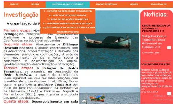
Figura 4: Produto Educacional da dissertação de A.S.C Garrido - Etapas da investigação

A figura 3 do índice Sobre , apresenta as características sociohistórica, sociocultural, socioeconômica e socioambiental da Colônia Z-3, elementos que fazem parte dos levantamentos preliminares da investigação temática. Na figura 4 o índice Investigação Temática , apresenta a organização e descrição de cada etapa, os botões são direcionadores que encaminham o educador para esquemas com a descrição passo a ser desenvolvido em cada etapa e Atividade Proposta. Na coluna de notícias, dispõem de um link direcionador para o documentário: Subjetividade e Trabalho Pesca Artesanal Colônia Z-3 , desenvolvido neste trabalho como apoio pedagógico, inclui ainda, os sites dos movimentos sociais e instituições atuantes na Colônia de Pescadores Z-3.