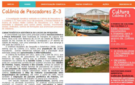
Figura 3: Produto Educacional da dissertação de A.S.C Garrido - Caracterização histórica

para facilitar o direcionamento do acesso as informações. Ainda na página inicial, recorte na figura 2, estão os temas geradores que emergiram na pesquisa. A partir deles, os educadores podem selecionar falas significativas: Pesca artesanal; Poluição; Eco-camping; Enchentes; Drogacidade e conta com um botão: Todas Etapas , que direciona para página da atividade proposta (que comentaremos mais adiante).