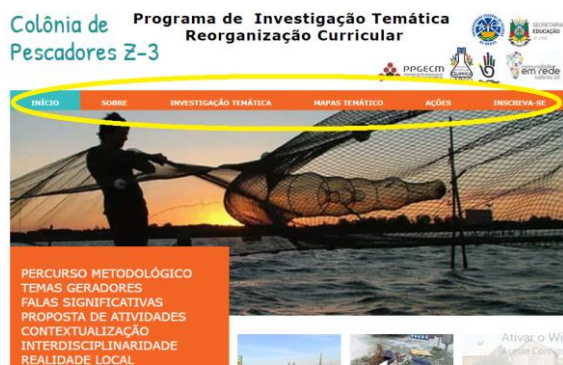
Figura 1: Produto Educacional da dissertação de A.S.C Garrido - Índice