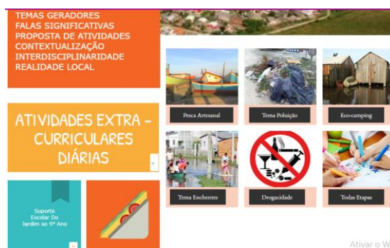
Figura 2: Produto Educacional da dissertação de A.S.C Garrido - Temas Geradores

Na figura 1, apresenta-se a interface do site, na barra superior, o índice, com os botões de Início , Colônia , Investigação Temática , Ações e Inscreva-se ,