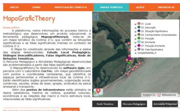
Figura 5: Produto Educacional da dissertação de A.S.C Garrido - MapoGrafTheory

A figura 3 do índice Sobre , apresenta as características sociohistórica, sociocultural, socioeconômica e socioambiental da Colônia Z-3, elementos que fazem parte dos levantamentos preliminares da investigação temática. Na figura 4 o índice Investigação Temática , apresenta a organização e descrição de cada etapa, os botões são direcionadores que encaminham o educador para esquemas com a descrição passo a ser desenvolvido em cada etapa e Atividade Proposta. Na coluna de notícias, dispõem de um link direcionador para o documentário: Subjetividade e Trabalho Pesca Artesanal Colônia Z-3 , desenvolvido neste trabalho como apoio pedagógico, inclui ainda, os sites dos movimentos sociais e instituições atuantes na Colônia de Pescadores Z-3.