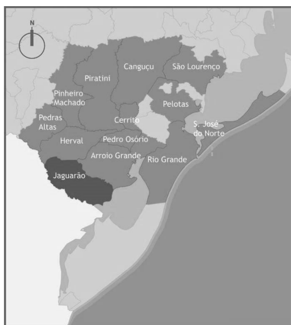
Figura 1: Mapa da região sul do Rio Grande do Sul, com destaque para as cidades estudadas e documentadas pela equipe do NEAB

A proposta possui relevância para a comunidade da região sul, já que a criação do site tem o intuito de divulgar, em meio digital, as ações e o acervo existente no núcleo desde meados anos 1980 sobre o patrimônio cultural de Pelotas e demais cidades da região sul do Rio Grande do Sul. Essa documentação referente ao patrimônio arquitetônico e urbano perpassa as atividades do NEAB e o currículo da FAUrb-UFPel há três décadas, contando com registros de obras de treze cidades do sul do Estado (Fig. 1).