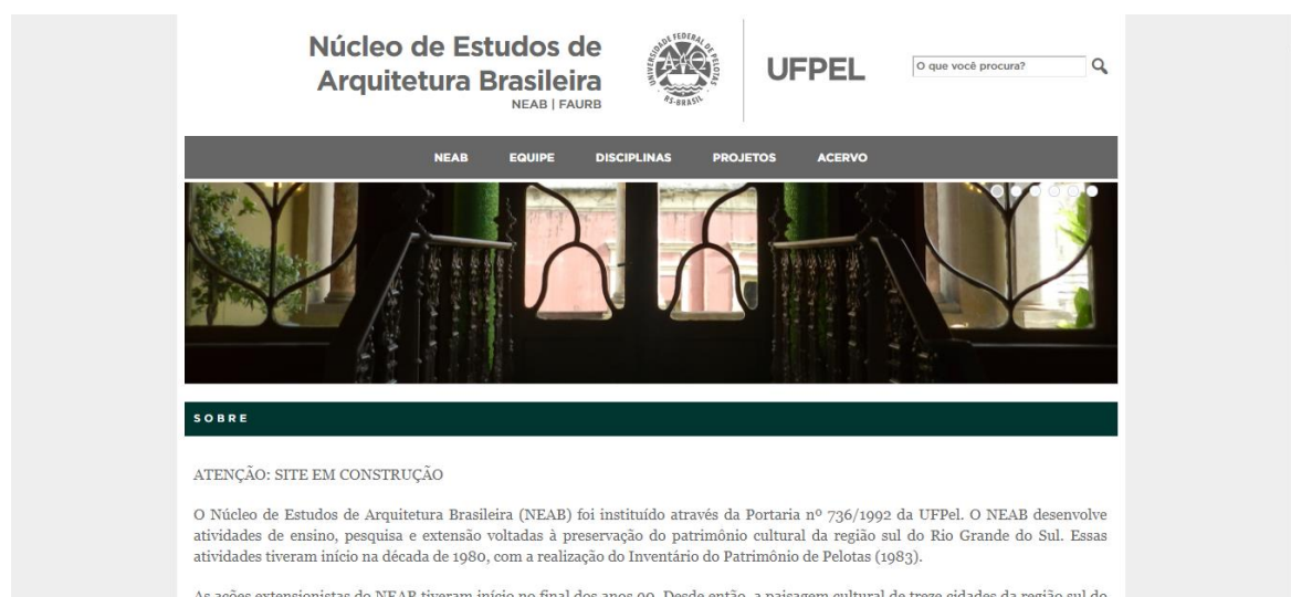
Figura 2: Tela de abertura do site

O processo de criação iniciou-se pela elaboração do layout do site. Em seguida foram determinadas as abas e sub-abas, propostas de modo a facilitar a pesquisa do visitante. Essas abas incluíram informações sobre a identificação do núcleo, a equipe que integra o NEAB, as disciplinas ministradas pelos professores e os projetos de ensino, pesquisa e extensão que coordenam, assim como o acervo disponível para pesquisa. Na página inicial do site foi criada uma pequena apresentação de slides com fotos de obras de arquitetura que foram registradas pelos colaboradores do núcleo (Fig 2).