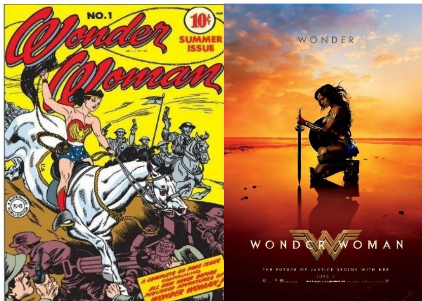
Figura - 1 Capa HQ Wonder Woman / Figura - 2 Cartaz filme Wonder Woman

Também irei analisar o cartaz estabelecendo relações entre elementos visuais, gráficos, semânticos e cromáticos, para que assim possa definir a ligação entre as HQs e os cartazes dos filmes, destacando sua importância para o design gráfico. É essencial para esta pesquisa a análise da capa da HQ (Figura 1) e do cartaz do filme (Figura 2) apresentado acima de forma que os principais elementos gráficos e visuais (cor, tipografia e composição) sejam abordados, para que assim possa ser feito um redesign deste cartaz baseando-se na capa da HQ em que foi inspirada.