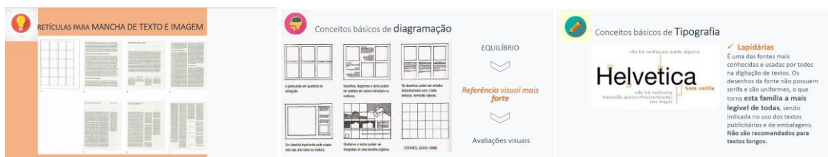
Figura 1) Slides desenvolvidos para o material de apoio

A partir da inserção do conteúdo de diagramação de pranchas na ementa da disciplina, foi necessário confeccionar-se um material de apoio em slides aplicado em aula teórico-expositiva e disponibilizado aos alunos no formato digital (Figura 1). A criação deste material foi baseada na literatura de CHING (2012) e MULLER-BROCKMANN (1982) a fim de fornecer conhecimento teórico básico e de fácil compreensão para diagramação de pranchas, abaixo segue um breve resumo dos principais tópicos na diagramação: