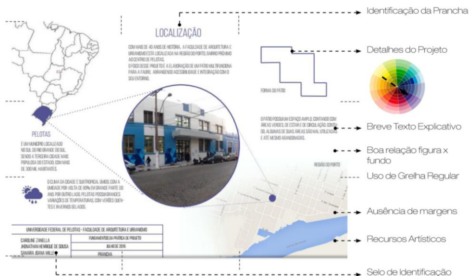
Figura 4) Análise de prancha no formato A4, desenvolvida por alunos

A diagramação criada pelos autores do trabalho demonstrado na Figura 3 deixa clara a aplicação de uma grade. De forma simples e objetiva, é possível compreender o projeto valorizado pela disposição em ritmo dos elementos, harmonia das cores e tratamentos das áreas que agrupam as informações.