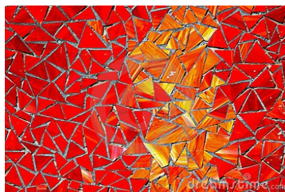
Figura 2 - Mosaico Vermelho, inspiração.

Uma técnica muito antiga, mosaicos são padrões visuais criados normalmente pela incrustação de pequenas pedras coloridas justapostas ou conglomeradas sobre uma superfície (Fig. 2). Esta definição se encaixou perfeitamente à nossa proposta de projeto: nosso mosaico contém pequenos fragmentos de grandes obras, mesclando e unindo artistas e designers em um só plano.