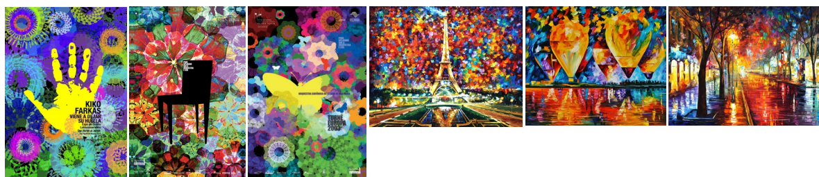
Figura 1 - Cartazes selecionados para a produção do cartão postal de Kiko Farkas e Leonid Afremov. (Fontes: kikofarkas.com.br e afremov.com, 2014)

Durante a fase criativa, planejamos como iríamos unir os artistas aos designers, de forma que fizesse alusão à forte ligação entre ambos, anteriormente comentada. Com os artistas definidos e organizados por movimento ou estilo, selecionamos três obras famosas de cada um (Fig. 1). Todavia, decidimos não revelar as obras inteiras nos cartões postais, e, sim, uma região em que pudéssemos identificá-la por seu caráter icônico. Ao “quebrar” as imagens, mostrando apenas algum detalhe, surgiu a ideia de fazer um “mosaico de cartazes”.