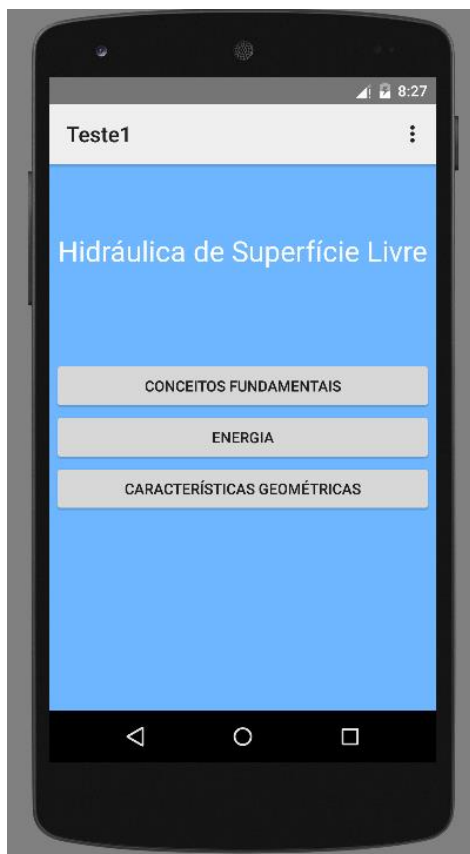
Figura 2 – Modelo do aplicativo