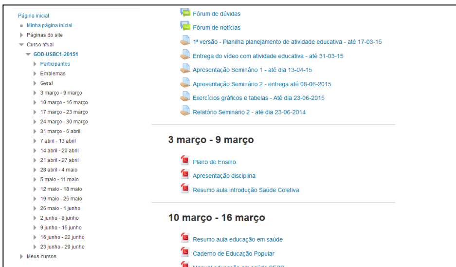
Figura 1. Disciplina de Unidade de Saúde Bucal Coletiva I no Ambiente Virtual de Aprendizagem - Moodle - da Universidade Federal de Pelotas.

notas dos trabalhos práticos e de avaliações teóricas. Junto a isso, confere a lista de presença e as publica no Cobalto.